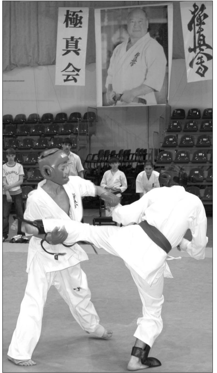
РОСТОВЧАНЕ ПОБЕДИЛИ С ОГРОМНЫМ ОТРЫВОМ.

Впечатляющий результат ростовской команды — свидетельство и доказательство того, что в настоящее время уровень подготовки спортсменов и работа тренеров Ростовской области являются лучшими в ЮФО.